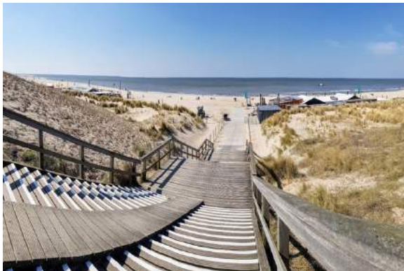
Strand van Kijkduin 1

Het NH Atlantic Hotel gaat volgend jaar tegen de vlakte. Daar komen een nieuw hotel en 145 woningen voor in de plaats. Ook moet een oppervlakte van 2200 vierkante meter worden gebruikt voor voorzieningen, zoals een congresruimte en wellness. Dat vindt Hart voor Den Haag natuurlijk geweldige ontwikkelingen, maar met de sloopkogel gaan ook de afbeeldingen van de zeeslag van Ter Heijde, die nu in één der zalen van het NH Atlantic Hotel te bewonderen zijn, verloren. Hoe mooi zou het zijn als in het nieuwe