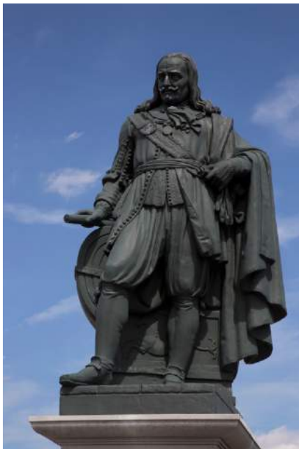
Beeld van Michiel de Ruyter 1

Hart voor Den Haag vindt dat we best trots mogen zijn op wie we zijn en waar we vandaan komen. Trots op de vele goede dingen uit het verleden en op de mythische figuren uit onze geschiedenis. Hierbij noemt Hart voor Den Haag de zeehelden Maarten Harpertszoon Tromp en Michiel de Ruyter, die beiden de bijnaam 'Bestevaer' kregen. Om hen te eren past het om deze zeehelden, die vochten voor onze vrijheid, een podium te geven in badplaats Kijkduin, de plaats vanaf waar in 1653 de slag om de Eerste Engels-Nederlandse Oorlog goed te zien was en waarbij Tromp het leven liet voor de Republiek der Verenigde Nederlanden. Nu de verbouwing van Kijkduin bijna gereed is, past het om het Deltaplein te vernoemen naar De Ruyter (het Michiel de Ruyterplein) en de aangrenzende Hoek van Hollandlaan naar Tromp (de Trompboulevard). In het Zeeheldenkwartier is er al een De Ruyterstraat en een Trompstraat, maar juist Kijkduin is een uitermate geschikte plek om de zeehelden te eren omdat, zoals eerder vermeld, vanaf Kijkduin de slag bij Ter Heijde in 1653 goed te volgen was. Bij de zeeslag bij Ter Heijde