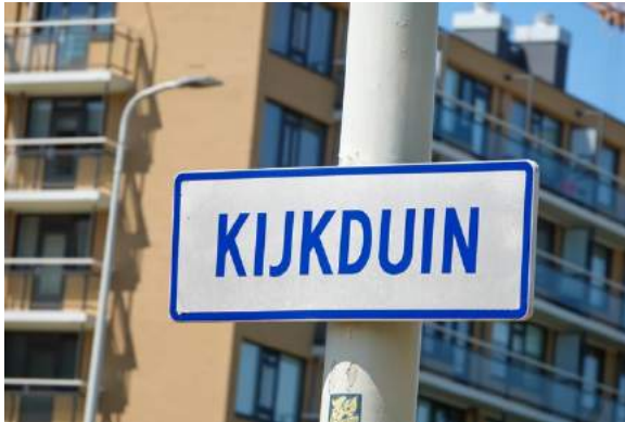
Plaatsnaamboord op Kijkduin 1

Met het initiatiefvoorstel 'Zeehelden eren in Kijkduin' pleit Hart voor Den Haag, naast de straatnamen, ook voor informatieborden op de boulevard die met mooie prenten informatie verschaffen over zowel de zeeslag als de zeehelden. De informatieborden kunnen voorbijgangers meer vertellen over de zeeslag en kunnen daarmee sterk bijdragen aan de beleving van Kijkduin, zeker als er ook een klein museum bij komt. Net als in andere landen zouden historische zee- en veldslagen veel meer aandacht moeten krijgen dan nu het geval is. Naast de informatieborden,