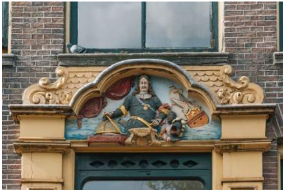
Gevelafbeelding van admiraal Tromp 1

Hart voor Den Haag wil ook uitgezocht hebben over op Kijkduin ruimte is voor twee standbeelden of tenminste een uithangbord of gevelsteen waar de beide vlootvoogden worden vereeuwigd. Hiernaar dient zowel een locatieonderzoek gedaan te worden als een kostenraming te worden gemaakt.