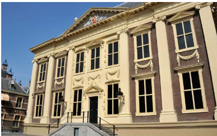
Het Mauritshuis 1

Hart voor Den Haag ergert zich groen en geel aan het steeds verder oprukkende wokisme, de discussie over Nederlandse historische figuren en de vraag of die 'fout' zijn geweest. Wij verwijzen daarbij onder meer naar de in 2017 verwijderde buste van Johan Maurits in het Mauritshuis in Den Haag, malle actiegroepen die eisen dat Den Haag zijn 'koloniale' straatnamen verandert en het besmeuren van het Indiëmonument en het