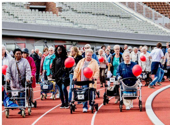
Rollatorloop in Amsterdam

Hart voor Den Haag heeft vastgesteld dat op diverse plaatsen in het land voor ouderen rollatorevenementen worden gehouden. In Amsterdam is de jaarlijkse rollatorloop in het Olympisch Stadion. Het doel is mensen uit hun eenzaamheid te halen en om bewegen onder ouderen in groepsverband te stimuleren. Hart voor Den Haag zou graag een jaarlijkse Haagse Rollatorloop organiseren. Deelnemers kunnen met een rollator, rolstoel of scootmobiel deelnemen.